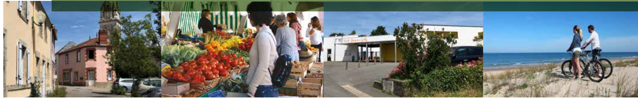
Un cadre de vie agréable